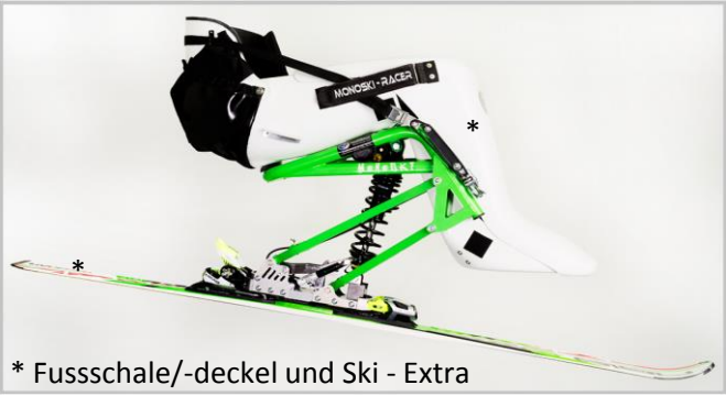
* Fusschale/-deckel und Ski - Extra